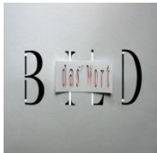
Das Wort haftet am Bild (50x50 cm) C-Print 2015