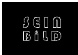
SEIN&BILD (65x85 cm) C-Print 2017