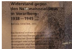
Mahn-/Wahn-/Denkmal 2teilig Teil 1( 50 x70 cm)