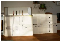
Atelier-Bild (Global-Log 1/8 & 2/8) 2017