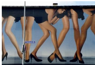
Serie Wolfort 2/8